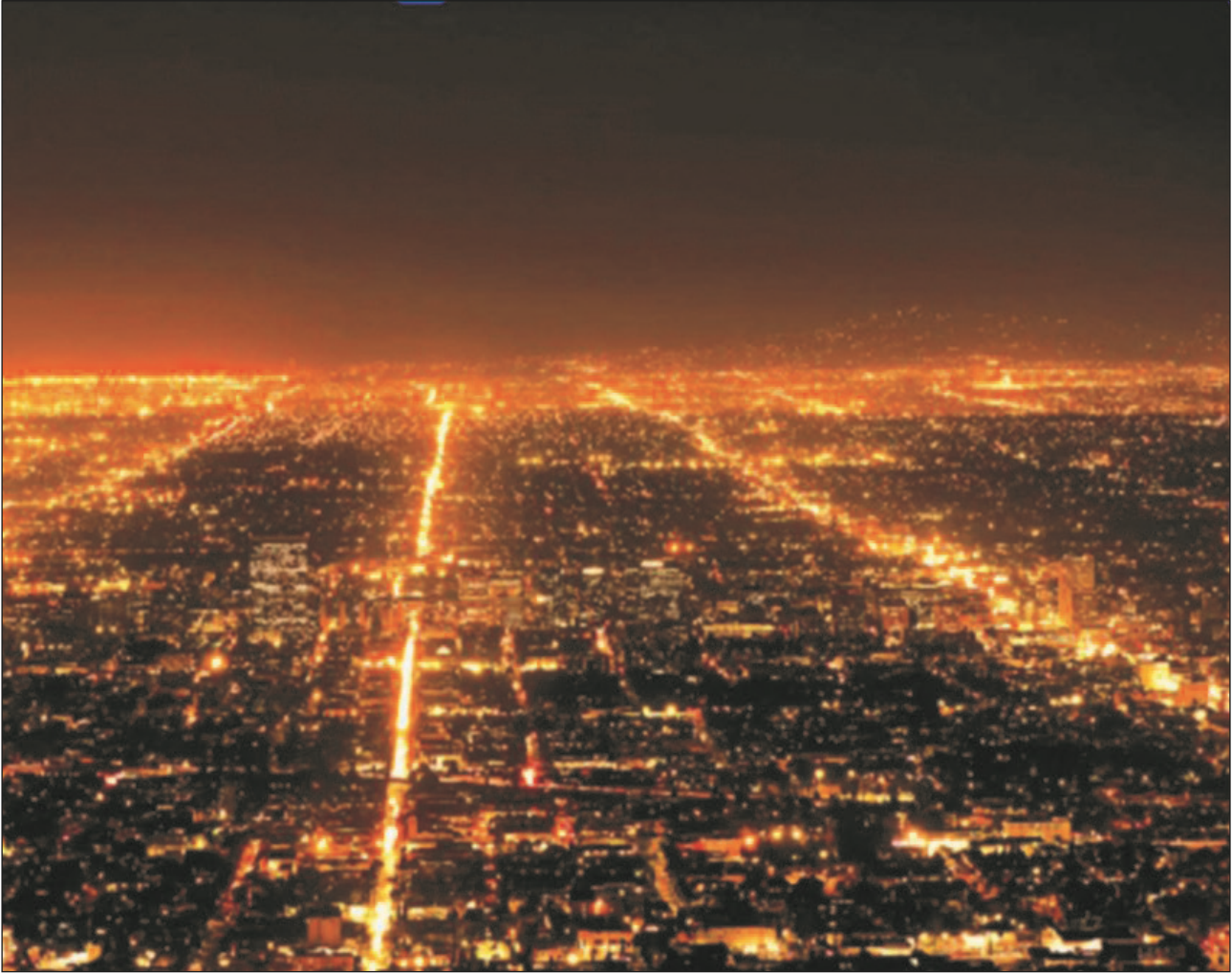
Figura 4: Resplandor a gran escala generado por la iluminación artificial y reforzado por la dispersión atmosférica sobre un área urbanizada.

Varias declaraciones e informes de organismos internacionales señalan que el cielo es un recurso científico compartido que debe preservarse para las generaciones futuras. Particularmente en un momento en que han surgido propuestas peculiares que imaginan flotas de satélites actuando como espejos orbitales para iluminar regiones seleccionadas después del atardecer. Afortunadamente, esta creciente concienciación está impulsando debates públicos y políticos en Europa y Norteamérica, mientras astrónomos, ecólogos y urbanistas unen fuerzas para reclamar políticas nuevas y más estrictas que prioricen la