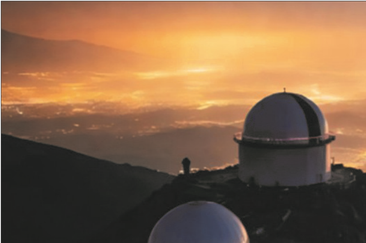
Figura 1: Impresión artística del resplandor artificial del cielo extendiéndose desde áreas urbanas hacia observatorios de montaña cercanos, ilustrando cómo la iluminación de ciudades distantes puede degradar la calidad del cielo nocturno incluso en emplazamientos de gran altitud.

está empezando a cubrirse con nuevos datos procedentes del SDGSAT 1 (Sustainable Development Science Satellite 1), el primer satélite diseñado específicamente para la Agenda 2030 de la ONU para el Desarrollo Sostenible. Lanzado por la Academia China de Ciencias en 2021, proporciona datos de observación terrestre con sensores térmicos infrarrojos, de baja iluminación y multiespectrales para monitorizar las interacciones entre humanos y naturaleza, el desarrollo urbano y los cambios ambientales. Estudios comparativos entre VIIRS y SDGSAT 1 muestran una subestimación significativa y sistemática de la contaminación lumínica global, especialmente alrededor de los centros urbanos. Donde los datos de VIIRS sugerían tendencias estables o incluso decrecientes, SDGSAT 1 reveló un rápido aumento de las emisiones ricas en azul, señalando un