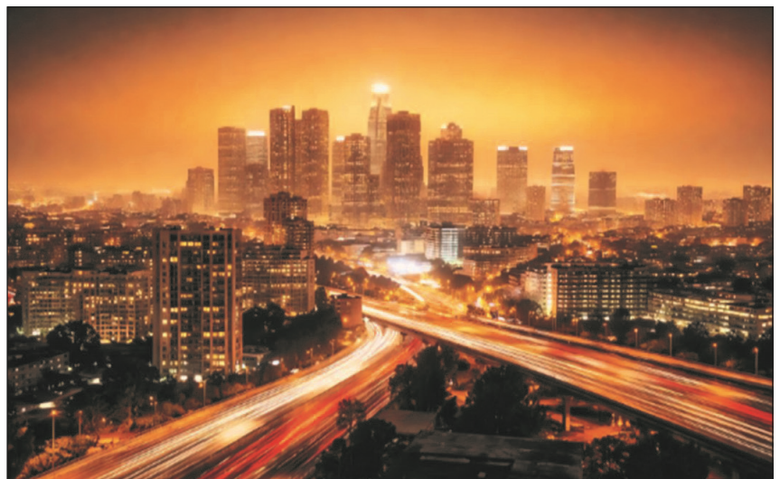
Figura 3: Un denso perfil urbano con iluminación artificial incrementa notablemente el brillo del cielo e impide la visibilidad de las estrellas.

hacer mucho para recuperarla. Esto nos lleva a otra paradoja, porque si bien la astronomía está entrando en una era de estudios ambiciosos y mediciones de precisión, con un renovado interés público y miles de millones en inversiones, por otro lado las tendencias de contaminación lumínica están fuera de control y corren el riesgo de limitar la producción científica de los principales instrumentos terrestres. El impacto en las estrategias de observación y en los presupuestos tampoco es despreciable: se estima que un aumento del 10% en el brillo del cielo requiere un incremento comparable en el tiempo de integración para recuperar la relación señal ruido perdida. Para observatorios multimillonarios con programas que se extienden durante décadas, esto se traduce en meses adicionales de tiempo de observación, con un impacto presupuestario significativo. Las preocupaciones sobre la contaminación lumínica están aumentando tanto entre la comunidad astronómica profesional como entre la amateur, con grandes organizaciones y observatorios mostrando inquietud por el ritmo y la trayectoria de la transición hacia la iluminación exterior moderna.