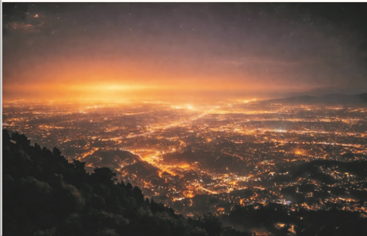
Figura 2: Extenso resplandor urbano que muestra cómo la luz artificial de una región metropolitana crea una cúpula brillante sobre el horizonte, reduciendo significativamente la oscuridad del cielo nocturno en grandes áreas.

ocurrir, las nuevas instalaciones son significativamente más brillantes que las lámparas que sustituyen, aunque sigan siendo más baratas, generando ahorros que con frecuencia se reinvierten para iluminar zonas que antes permanecían oscuras, como parques, fachadas arquitectónicas y corredores suburbanos. El cambio hacia iluminación rica en azul es especialmente perjudicial para la astronomía, ya que las longitudes de onda más cortas se dispersan mucho más eficientemente que las largas; se estima que la luz azul alrededor de 440 nm se dispersa unas 2,5 veces más que la luz verde amarilla (550 nm). Esto significa que un solo LED blanco contribuye de manera desproporcionada a la cúpula difusa del resplandor del cielo, incluso si su flujo luminoso total es menor que el de la lámpara que reemplazó.