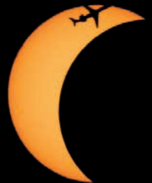
El eclipse americano