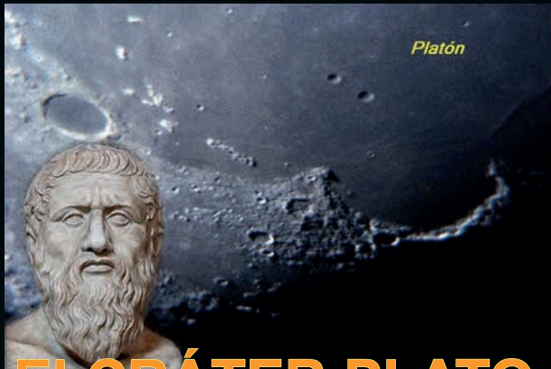
EI CRÁTER PLATO