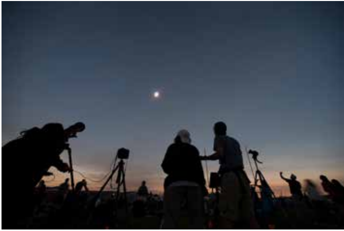
FOTÓGRAFOS Y TOTALIDAD. (MADRAS, OREGÓN)