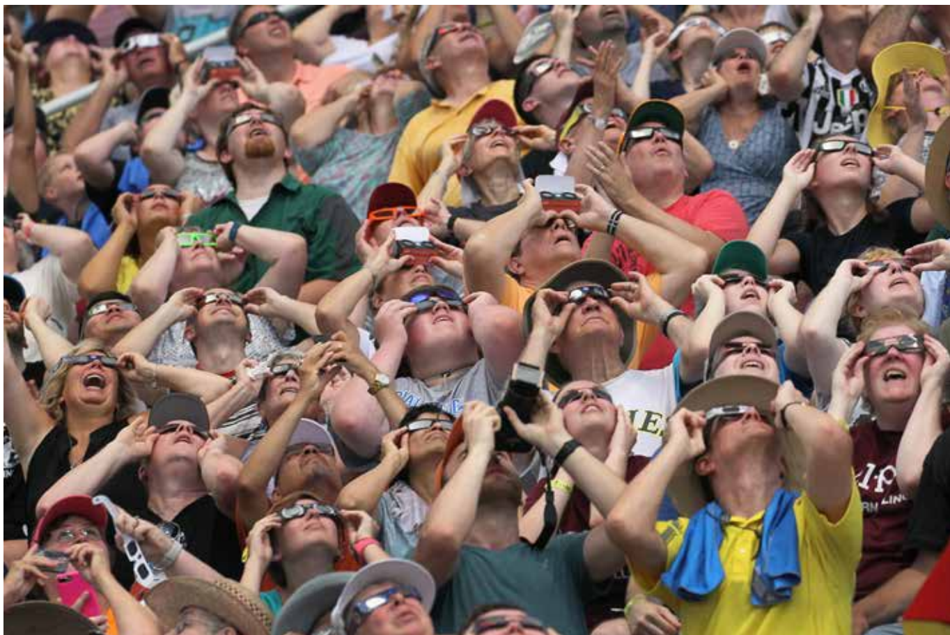
LA GENTE MIRA EL ECLIPSE SOLAR EN EL ESTADIO DE SALUKI EN EL CAMPUS DE LA UNIVERSIDAD MERIDIONAL DE ILLINOIS EN CARBONDALE, ILLINOIS.