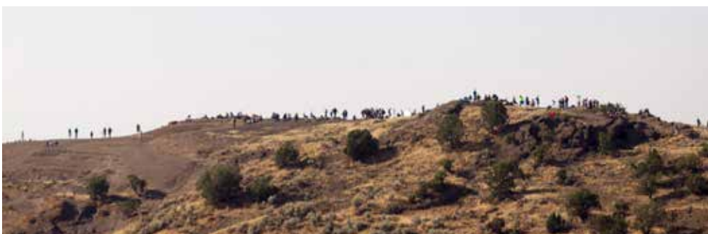
OBSERVADORES LOCALES Y VIAJEROS DE TODO EL MUNDO SE REÚNIERON EN MENAN BUTTE IDAHO.