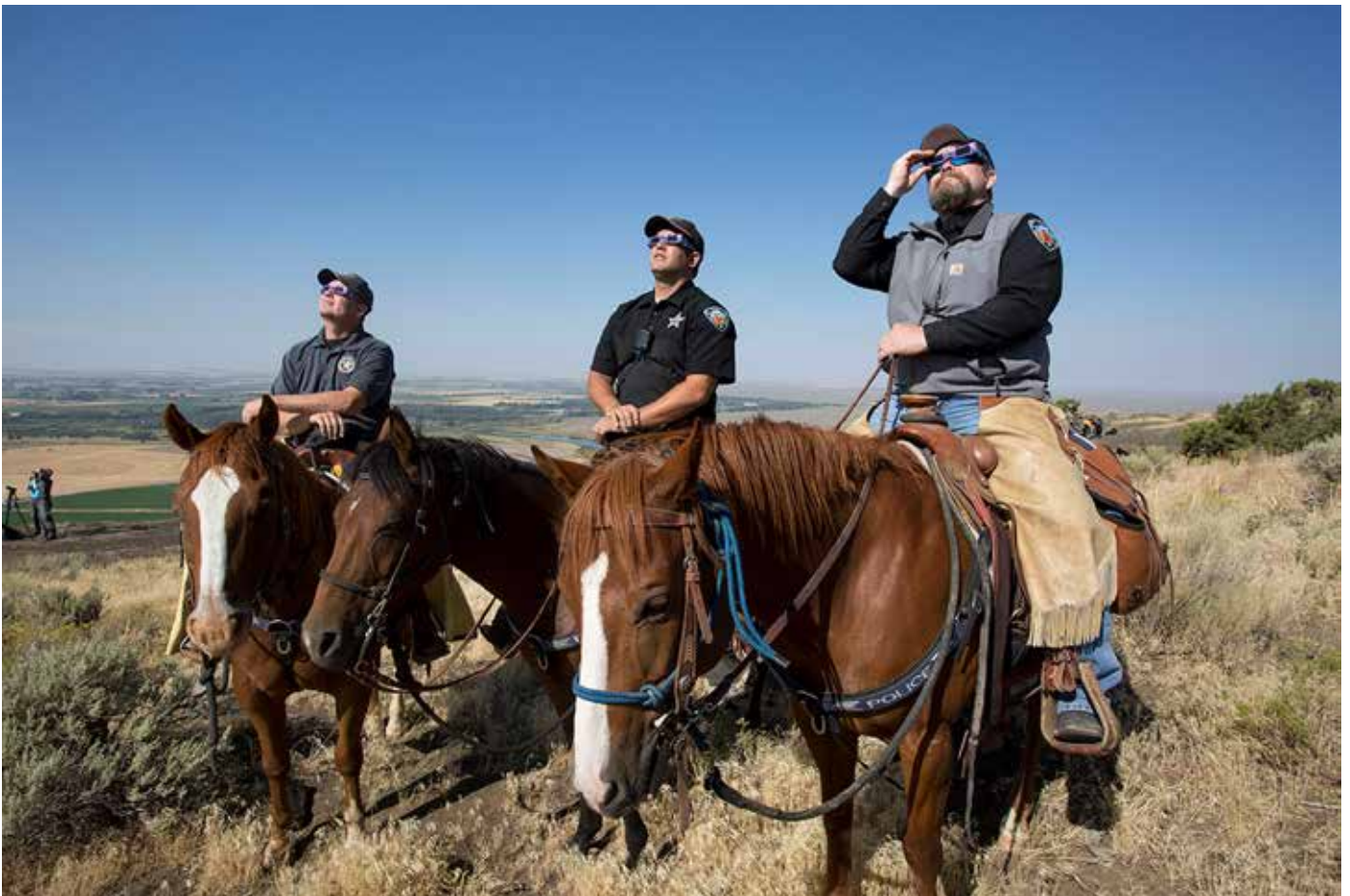
LA PATRULLA MONTADA DEL SHERIFF DEL CONDADO DE MADISON MIRA EL ECLIPSE ENCIMA DE SUS CABALLOS EN MENAN BUTTE, MENAN, IDAHO.