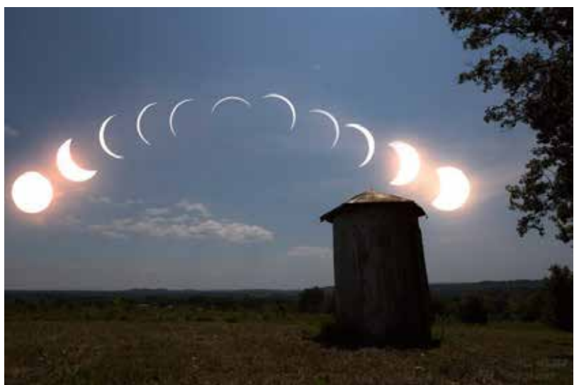
SUE WADDELL REALIZÓ ESTA COMPOSICIÓN DEL ECLIPSE DESDE EASTVIEW, KENTUCKY, DONDE HABÍA UN ECLIPSE DE 98.3%.