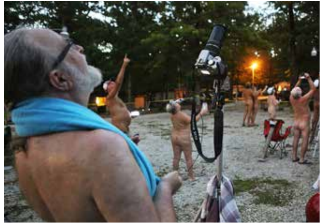
MIEMBROS E INVITADOS DEL CLUB FORTY ACRE, UN CLUB NUDISTA CERCA DE LONEDELL, TOMARON FOTOS DEL ECLIPSE CUANDO SE ACERCABA LA TOTALIDAD. TRESIENTOS CINCUENTA Y CUATRO ADORADORES DEL SOL ESTUVIERON PRESENTES DURANTE LAS FESTIVIDADES DE ESE FIN DE SEMANA. (LONEDELL, MISSOURI) (COMO PUEDE VERSE, SIN PROTECCIÓN OCULAR, COMO MÍNIMO)