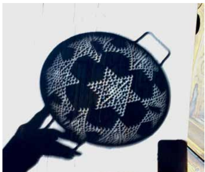
KATHY PETERSON MORTON EN CRESTED BUTTE, COLORADO ESCRIBIÓ: "EL ECLIPSE A TRAVÉS DE MI COLADOR!"