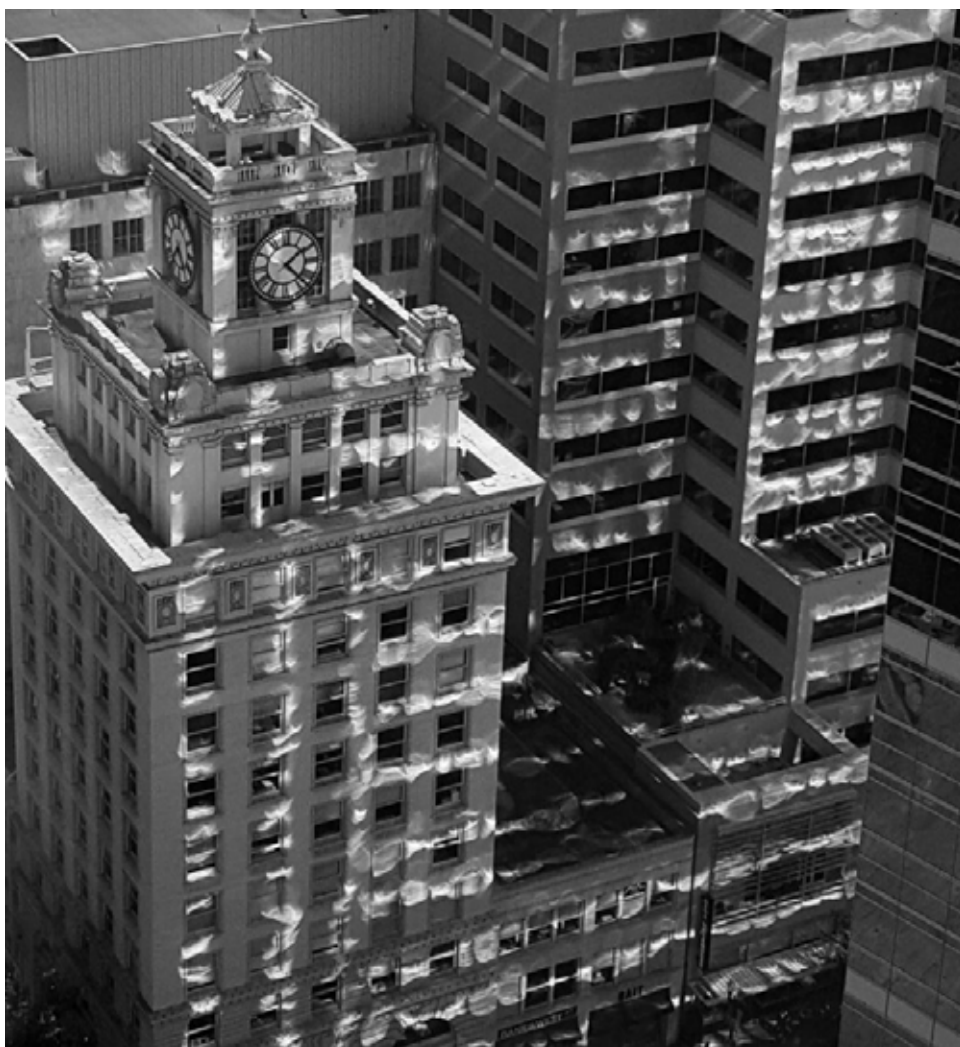
EFFECTOS ESPECIALES DE LA SOMBRA EN LA FASE DE PARCIALIDAD EN DOWNTOWN, PORTLAND, OREGON