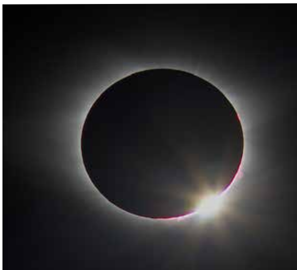
EL EFECTO DEL ANILLO DE DIAMANTE, LAS LLAMARADAS SOLARES, Y LA CROMOSFERA. FOTO TOMADA POR ROB PETTENQILL EN TORRINGTON, WYOMING.