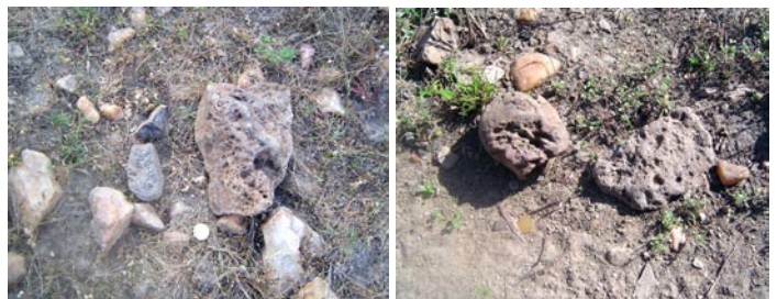
FIGURA 02. LOCALIZACIÓN DE LAS LAGUNAS SELECCIONADAS, DETALLE DE LOS POSIBLES “IMPACTITOS” ENCONTRADOS

Hay que destacar que en dicha región semiárida brasileña, frecuentemente las estructuras lagunares son rasas e intermitentes. En esa región la precipitación de agua de lluvia es la única aportación hídrica que suministra a esas paleolagunas.