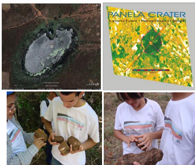
FIGURA 04. LA PALEOLAQUINA “do LUNARDO-PAN 002 (PB) y el CRÁTER “da PANELA” (PE), PRESENTAN EL MISMO ALINEAMIENTO.

Se han encontrado “ impactitos ” en estas estructuras, ellas presentan el mismo alineamiento, como puede verificarse en la figura 04 siguiente.