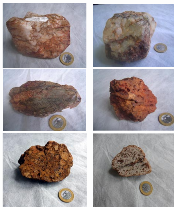
FIGURA 05. “ Impactitos ” de las estructuras do CAJUEIRO (1), do LUNARDO (2,3), da CRUZ (4), da PANELA (5,6).

A modo de ejemplo, a continuación algunas de las rocas metamórficas encontradas durante las búsquedas de campo: el la estructura “do Cajueiro” (PE) localizada en la “Zona da Mata”, en la ciudad de Paudalho, cuarzo brechado (1); en la estructura “do Lunardo-Pan-002 (PB) en la ciudad de Manaíra, cuarzo brechado parcialmente fundido (2) y gneis fundido (3); en la estructura “da Cruz-Pan-002b (PB) localizada en la ciudad de Manaira, gneis e suelo fundido (4); en el cráter “da Panela” (PE) localizada en la ciudad de Santa Cruz da Baixa Verde, gneis brechado (6). Estos “ impactitos ” se muestran en la figura 05.