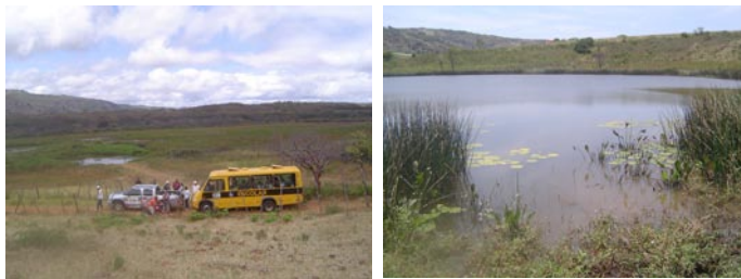
VISTA PARCIAL DE LA ORILLA DE LA LAGUNA DE LUNARDO (PB) y la de SANTA LUZIA (PE) donde se encontraron impactitos

El interior de las estructuras de las paleolagunas y la vista parcial de sus bordes pueden verse en la figura 06.