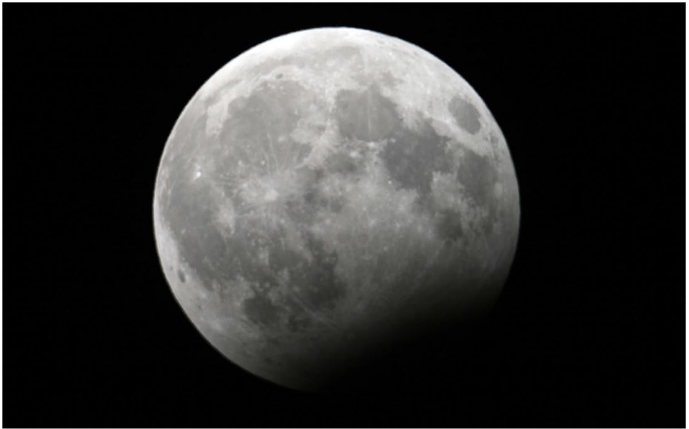
Eclipse de LUNA del 31-12-09.- JOANMA BULLON.- 19:23 (TU), desde el OBSERVATORIO LA CAMBRA DE ARAS de los Olmos. T. 250-1200, A 1/500 s.