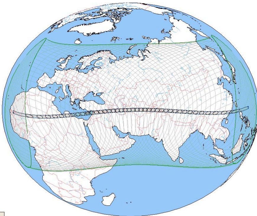
FIGURA 1: CONO DE SOMBRA DEL ECLIPSE DE 15 DE JUNIO DE 763 A.C.

El problema es más serio de lo que parece pues, como decía líneas atrás, este eclipse es el que se ha tomado como referencia cronológica para todo el Próximo Oriente, incluido Egipto, principalmente para el siglo VIII-VII a.C. Por tanto, si nuestra referencia es incorrecta, nuestra cronología para esa época también será incorrecta.