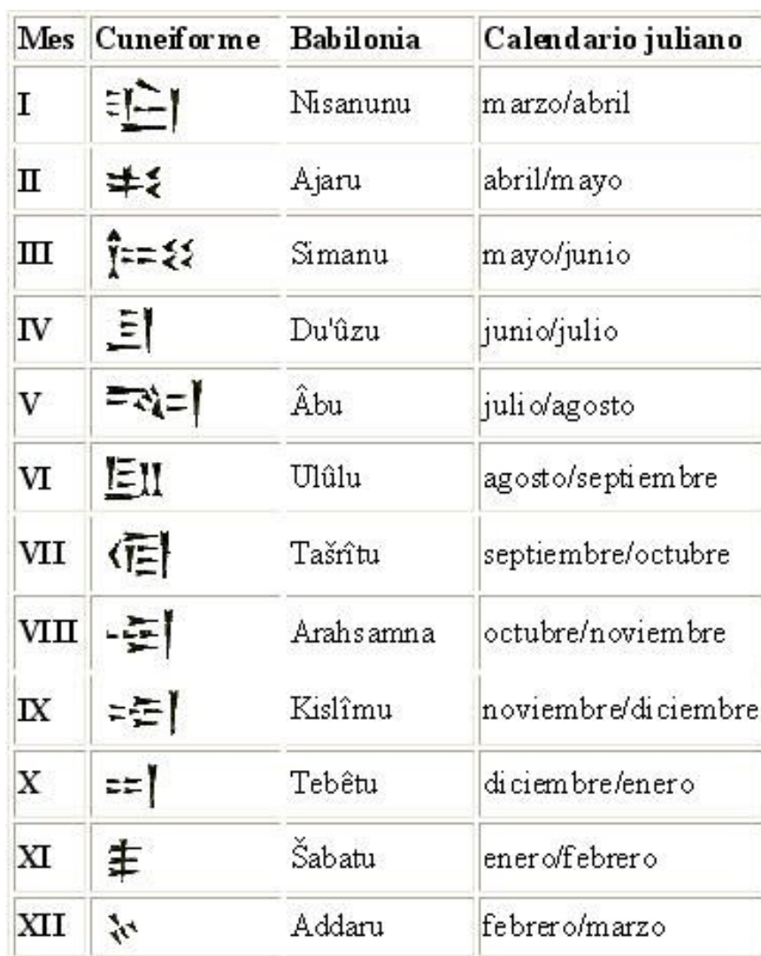
Tabla 1: LOS MESES DEL CALENDARIO BABILÓNICO

En un ciclo de 19 años solares, el calendario babilónico necesitaba de siete meses intercalares. Al comienzo del ciclo el mes intercalar se colocaba tras el mes de Ulûlu ,