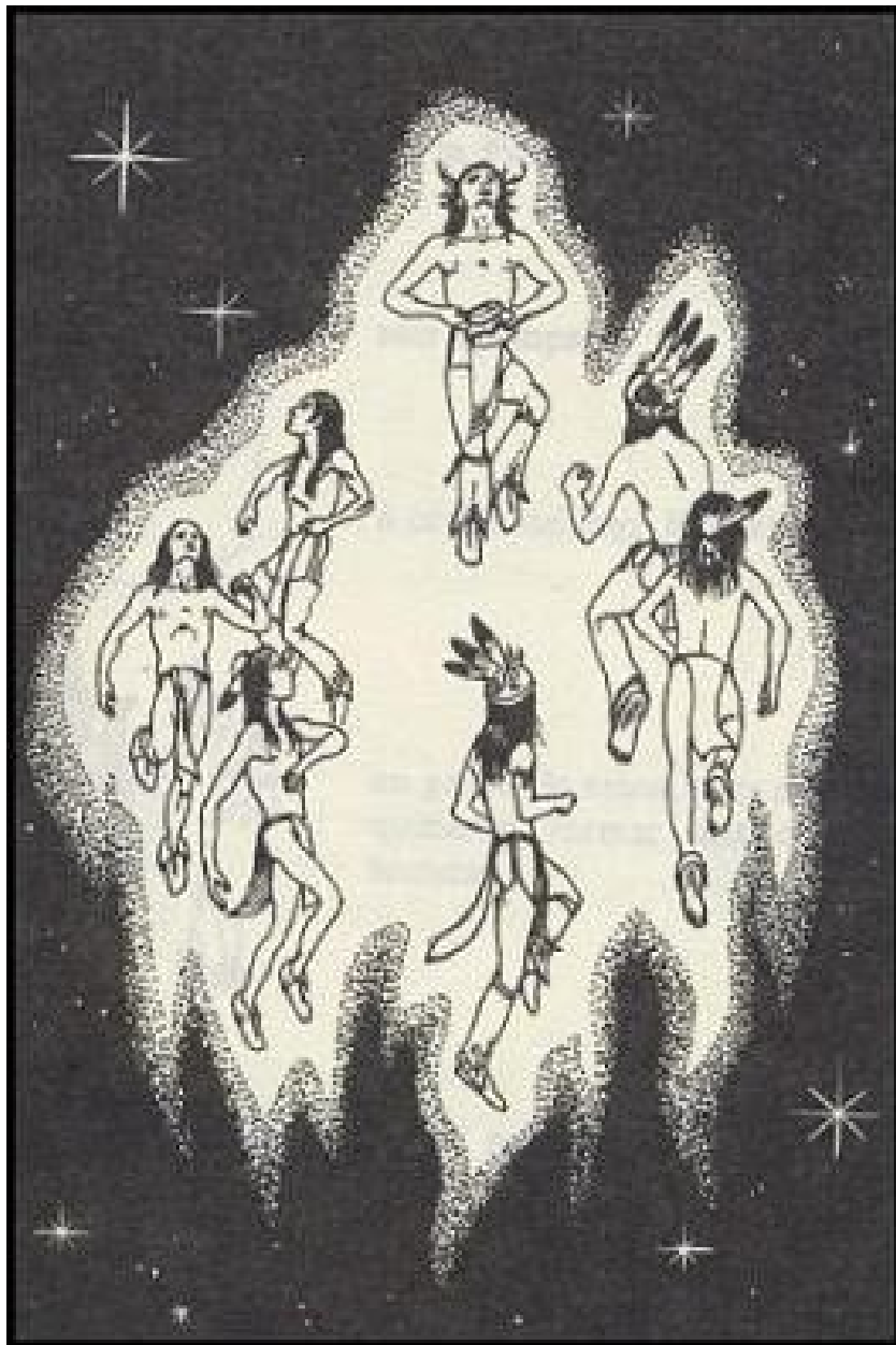
FIGURA 2: LOS SIETE DANZARINES IROQUESES QUE, DE TANTO BAILAR, SE ALZARON HACIA LOS CIELOS Y SE CONVIRTIERON EN LAS PLÉYADES, SEGÚN LA TRADICIÓN IROQUESA. (Kahionhes)

Un día el pequeño Jefe sugirió hacer un banquete en su próximo Consejo ante el Fuego. Cada uno