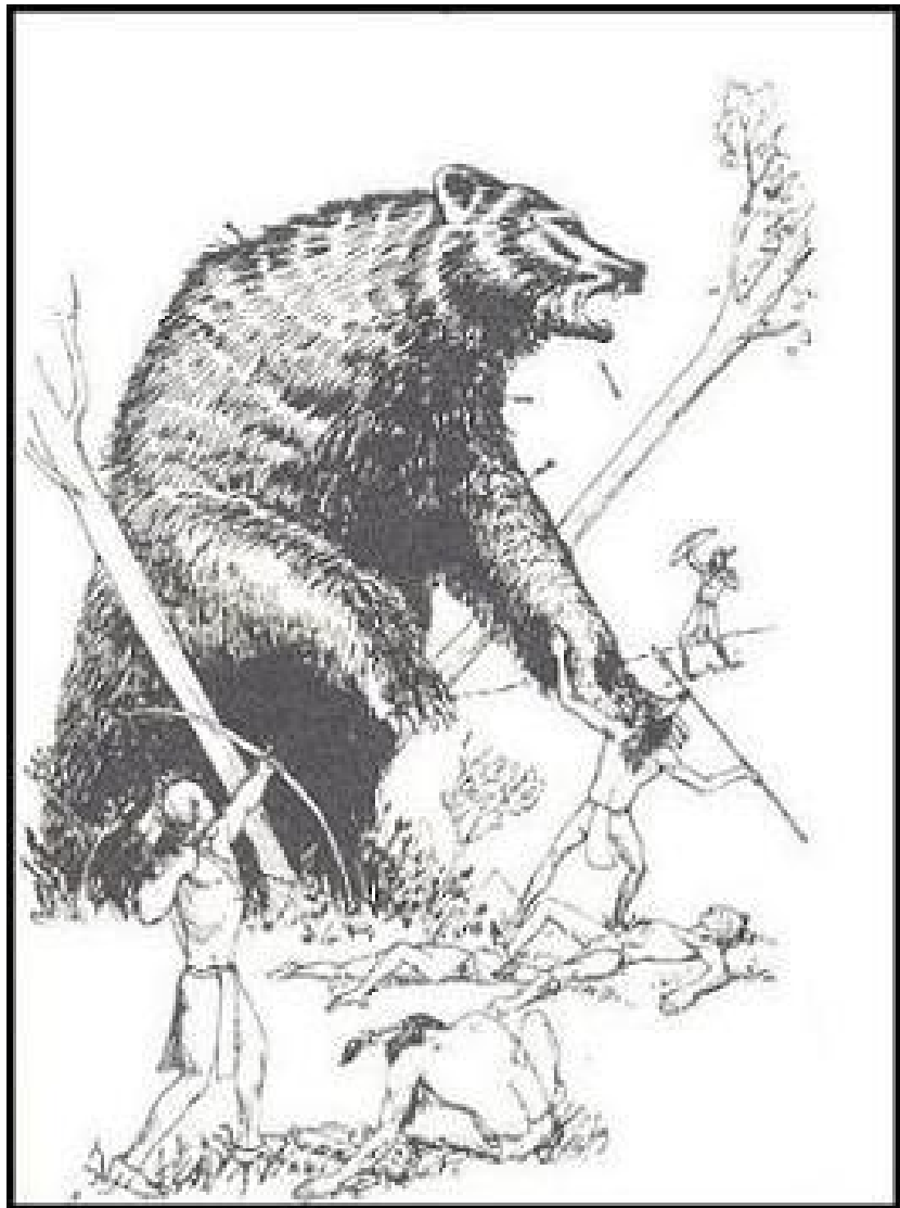
FIGURA 3: LA CAZA DEL GRAN OSO POR PARTE DE LOS GUERREROS IROQUESES. CUANDO HOY EN DÍA VEMOS LA OSA MAYOR, ESTAMOS VIENDO, SEGÚN SU TRADICIÓN, A LOS TRES HERMANOS CAZADORES PERSIGUIENDO AÚN AL ANIMAL EN LOS CIELOS. (KAHIONHES)

Y comienza así: hace muchísimos inviernos siguiendo el curso