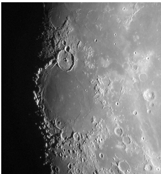
LOCALIZACIÓN DEL "MARE HUMORUM" SITUADO EN UNA ZONA MUY VISIBLE DE LA LUNA, CERCA DEL CRATER TYCHO

Se prevé que el cráter sea de entre 3 y 10 metros de diámetro y que se produzca una eyección de masa de