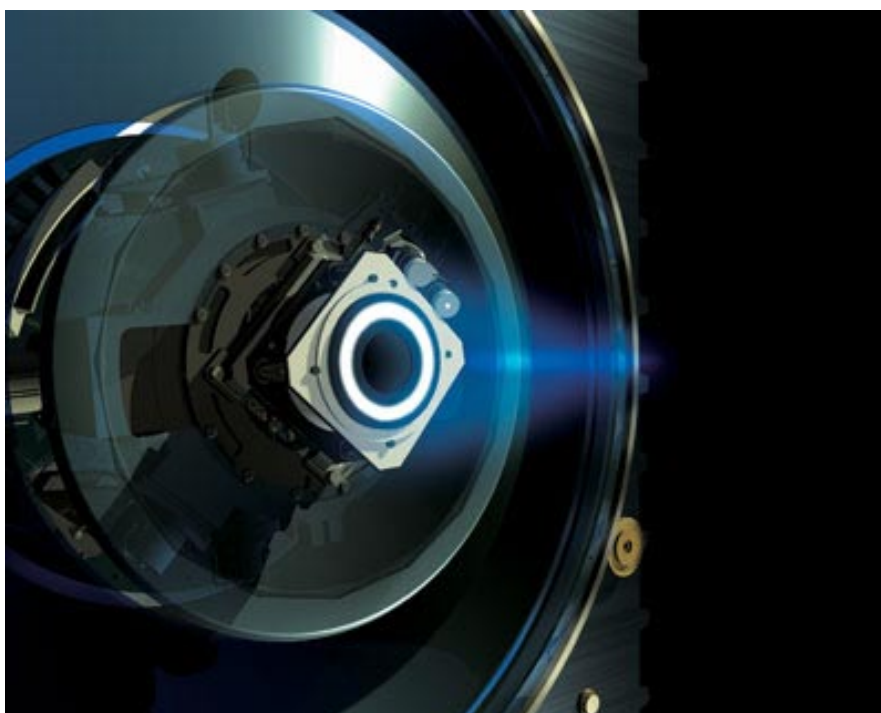
EL MOTOR IÓNICO EN PLENO FUNCIONAMIENTO