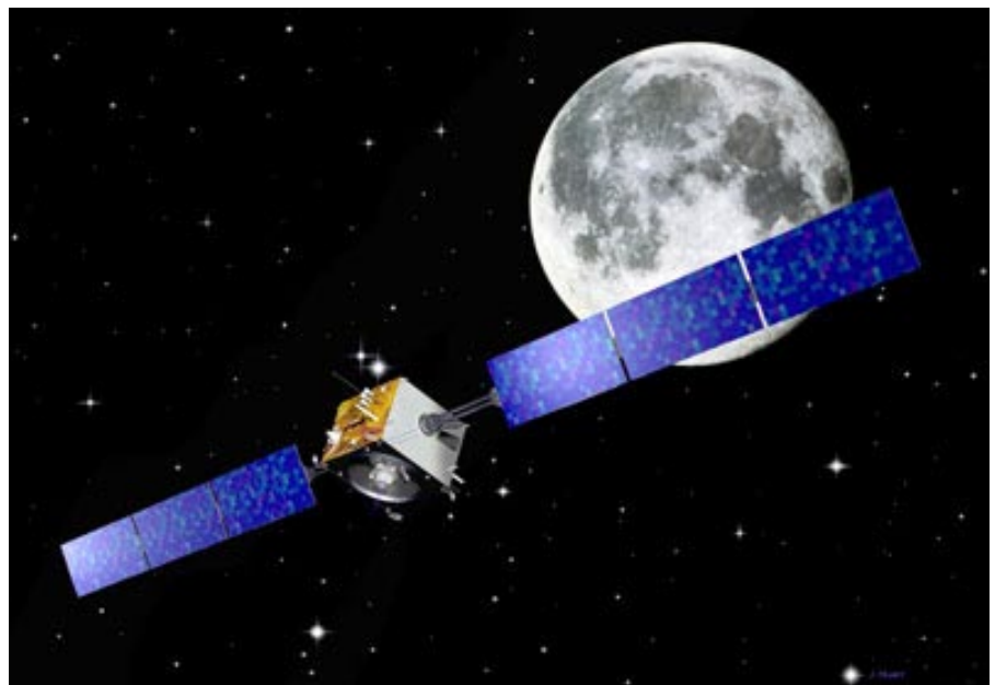
Visión ARTÍSTICA DE LA SONDA SMART-1 EN SU VIAJE HACIA LA LUNA